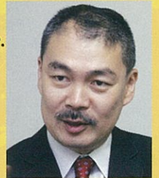
藤井 聡先生 (京都大学大学院教授)